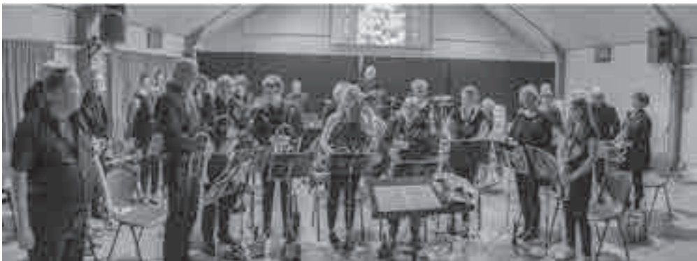
De Fanfare van MVU samen Schermers Fanfare.

Muziekvereniging Ursem bestaat 50 jaar en organiseert diverse activiteiten om dit te vieren. Het hoogtepunt is wel het grote Jubileumconcert op zaterdag 30 juni a.s. op de Middengouw, in een grote tent op het plein voor 'Batter'. Aan dit concert zullen alle muziekverenigingen van Gemeente Koggenland deelnemen te weten; Muzieklust Obdam, Accordando Spierdijk, Volharding Berkhout, Kunst en Kracht uit De Goorn en natuurlijk de vereniging zelf.