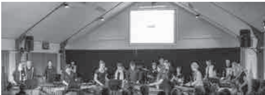
De Slagwerkgroep van MVU tijdens Voorjaarsconcert 2018.

De Slagwerkgroep staat als laatste op het programma en we sluiten het programma af met een gezamenlijk nummer voor de Fanfare en de Slagwerkgroep wat speciaal voor deze gelegenheid geschreven is. Kortom het wordt een hele unieke middag én avond waar het publiek kosteloos aanwezig mag zijn en hopelijk massaal een toast komt uitbrengen op de jubilaris! Graag tot ziens op zaterdag 30 juni as om 15.30 uur op Ursem!