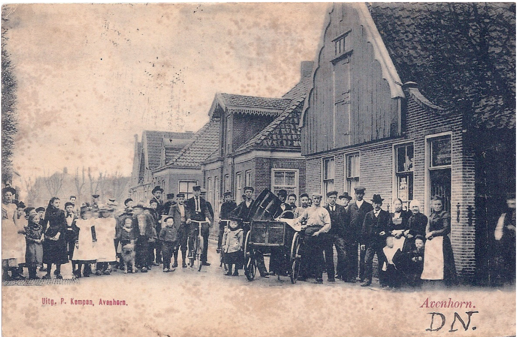
Uitg. P. Kempen, Avenhorn.